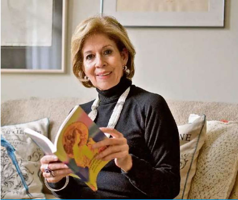
Leda. Carmen Matute de Fonca

La escritora guatemalteca Carmen Matute, Premio Nacional de Literatura 2015, miembro de número de la Academia Guatemalteca de la Lengua –AGL–, y correspondiente de la Real Academia Española –RAE–, no necesita presentación en el ámbito de las letras; ella se presenta sola: la precede una obra reconocida tanto en el plano nacional como internacional, la cual siempre precisará de una relectura. En el transcurso de su destacada carrera, su pluma ha construido escenarios que exploran la profundidad de la condición humana, lo que la ha convertido en una de las voces más destacadas y reconocidas de la poesía y narrativa contemporánea.