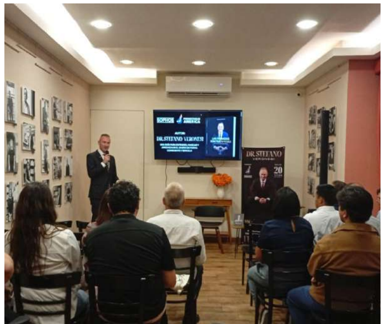
Presentación en Librería Sophos