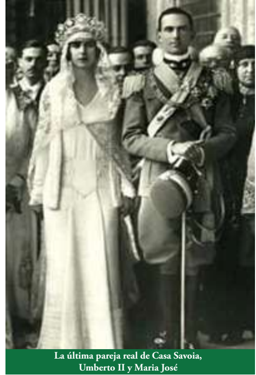
La última pareja real de Casa Savoia, Umberto II y Maria José

como el “Rey de Mayo” porque reinó apenas 35 días, del 9 de mayo al 13 de junio de 1946. Fue un soberano de transición, respetado por su estilo sobrio y por su intento de mantener un clima sereno durante el referéndum institucional del 2 de junio. Su inclinación reformista era limitada por el peso del pasado de la monarquía, así que, tras la proclamación de los resultados del referéndum, para evitar tensiones y desórdenes en la calle, Umberto abandonó Italia rumbo al exilio en Portugal, donde murió en 1983. Con él se cerraba definitivamente la larga trayectoria de la dinastía de los Savoia que había nacido en el siglo XI con Umberto Biancamano.