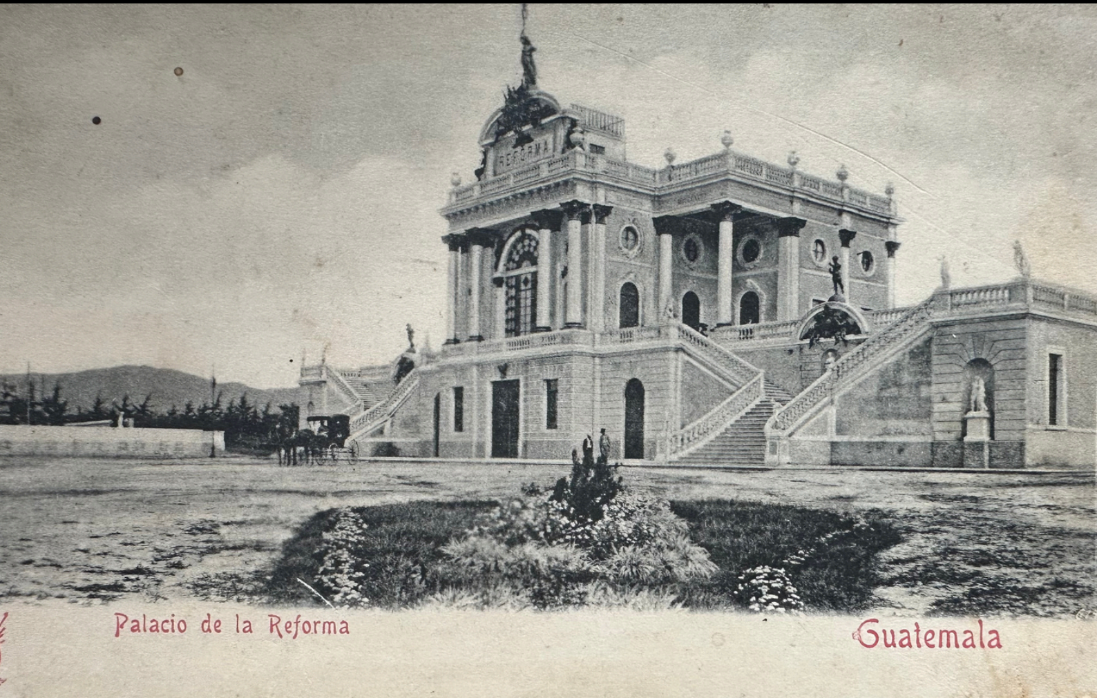
Palacio de la Reforma

El primero nos lleva 250 años atrás justo para el traslado de la ciudad de Santiago de los Caballeros después de los terremotos de Santa Marta en 1773 hacia la nueva Guatemala de la Asunción en el Valle de la Ermita en 1776. Muy próximo al lugar donde el genovés Juan Corz trajo la imagen de Nuestra Señora del Carmen en 1595.