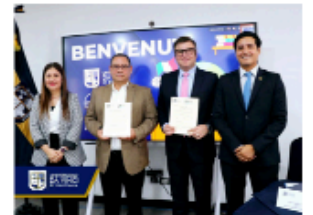
CONVENIO ENTRE UNIVERSIDAD DA VINCI Y ASOCIACIÓN DANTE ALIGHIERI DE GUATEMALA