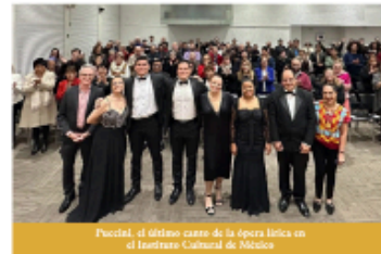
Puccini, el último canto de la ópera lírica en el Instituto Cultural de México

El Instituto Italiano de Cultura cerró el 2024 con dos exitosos recitales de música lírica dedicados al gran maestro Giacomo Puccini en ocasión de los 100 años de su fallecimiento.