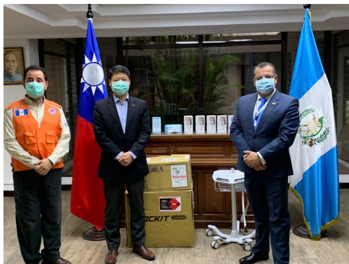
Fecha: 10 de junio 2020

Al 7 de junio, Taiwán lleva 56 días consecutivos sin casos de infección local. No tuvo confinamiento y solo ha tenido 443 casos, de los cuales 430 se han recuperado. Sus esfuerzos rápidos y exitosos de prevención del coronavirus han sido elogiados por la comunidad internacional. Asimismo, Taiwán están tomando parte en la investigación de vacunas contra el COVID-19. Cinco organismos de investigación y compañías de biotecnología de Taiwán están desarrollando vacunas, la mayoría de las cuales se espera que entren en la fase de ensayos clínicos a finales de este año.